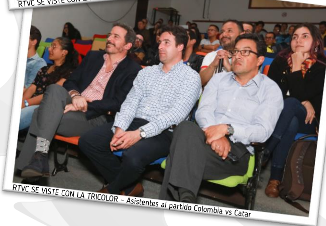
RTVC SE VISTE CON LA TRICOLOR - Asistentes al partido Colombia vs Catar