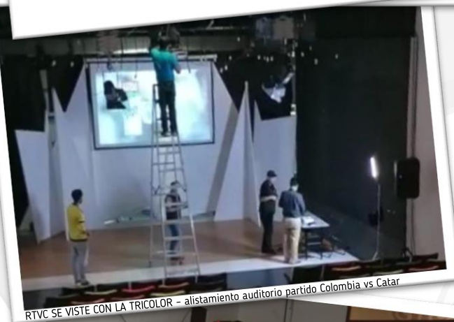
RTVC SE VISTE CON LA TRICOLOR - alistamiento auditorio partido Colombia vs Catar