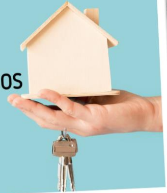
Foto: Feria De Servicios y Vivienda 2019

#SeSupoQue El próximo viernes 28 de junio de 9:00 a.m a 12:00 m, se llevará a cabo en RTVC la tradicional Feria de Vivienda y Servicios 2019.