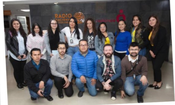
Foto: Nuevos funcionarios y colaboradores RTVC